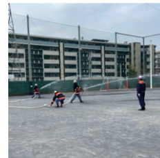
地域防災拠点（箕輪小学校）での防災訓練開催の様子