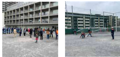
地域防災拠点（箕輪小学校）での防災訓練開催の様子