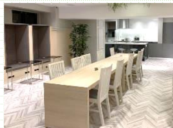
シェアダイニング