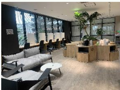
オープンスペース