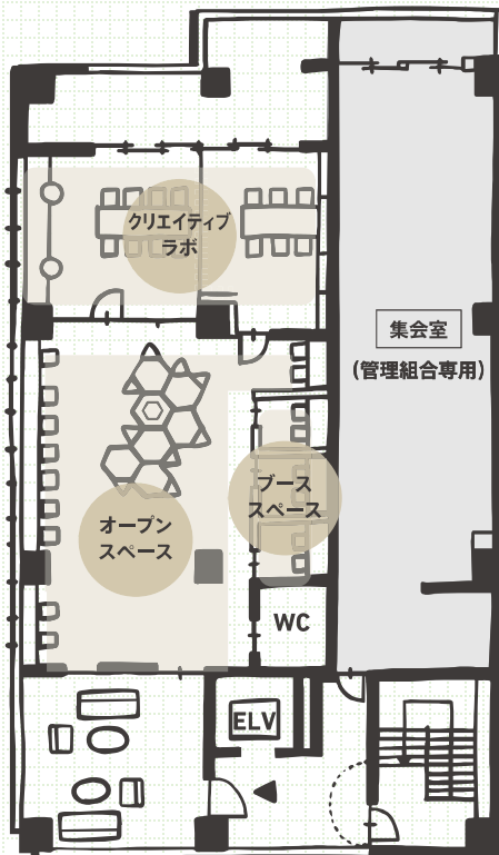
〈まちのワークスペース 平面図〉