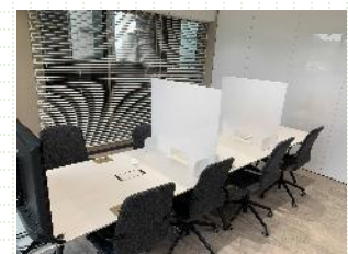
クリエイティブラボ