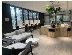
オープンスペース