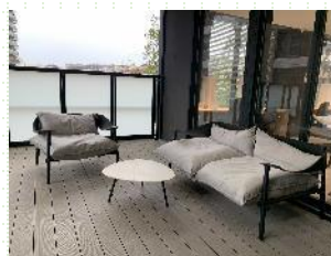
バルコニーデッキ