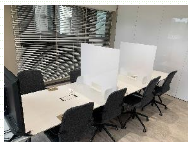
クリエイティブラボ