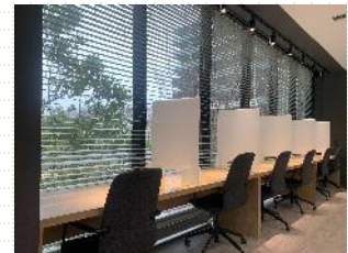
オープンスペース